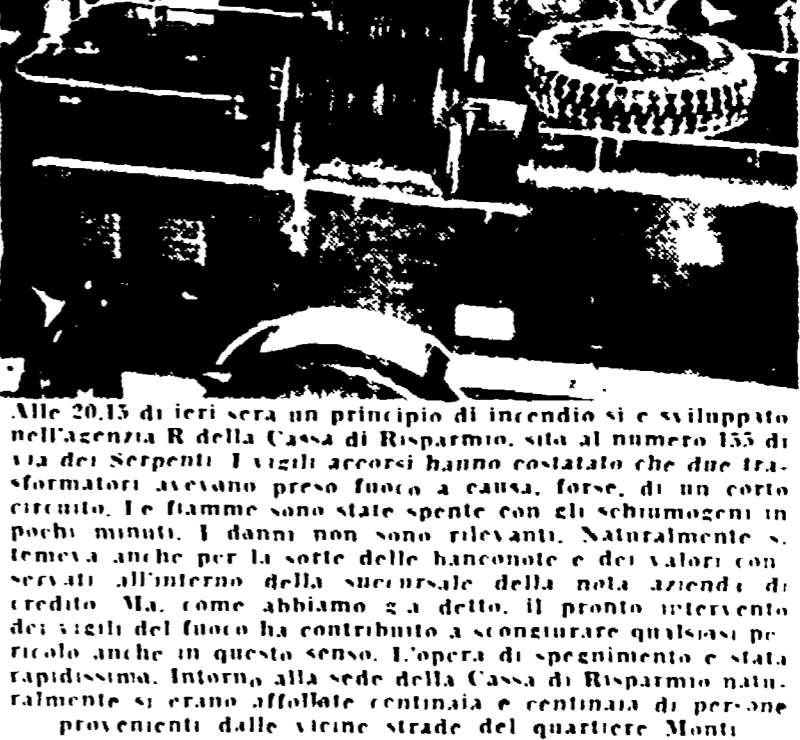
Alle 20.15 di ieri sera un principio di incendio si è sviluppato nell'area di Roma della Cassa di Risparmio, sito al numero 155 di via dei Serpenti. I vigili sono intervenuti e hanno costretto due trasformatori ad essere spenti.