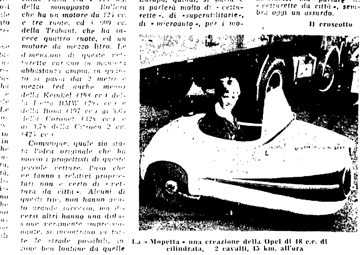
La «Mopetta» una creazione della Opel di 18 c.c. di cilindrata, 2 cavalli, 45 km. all'ora