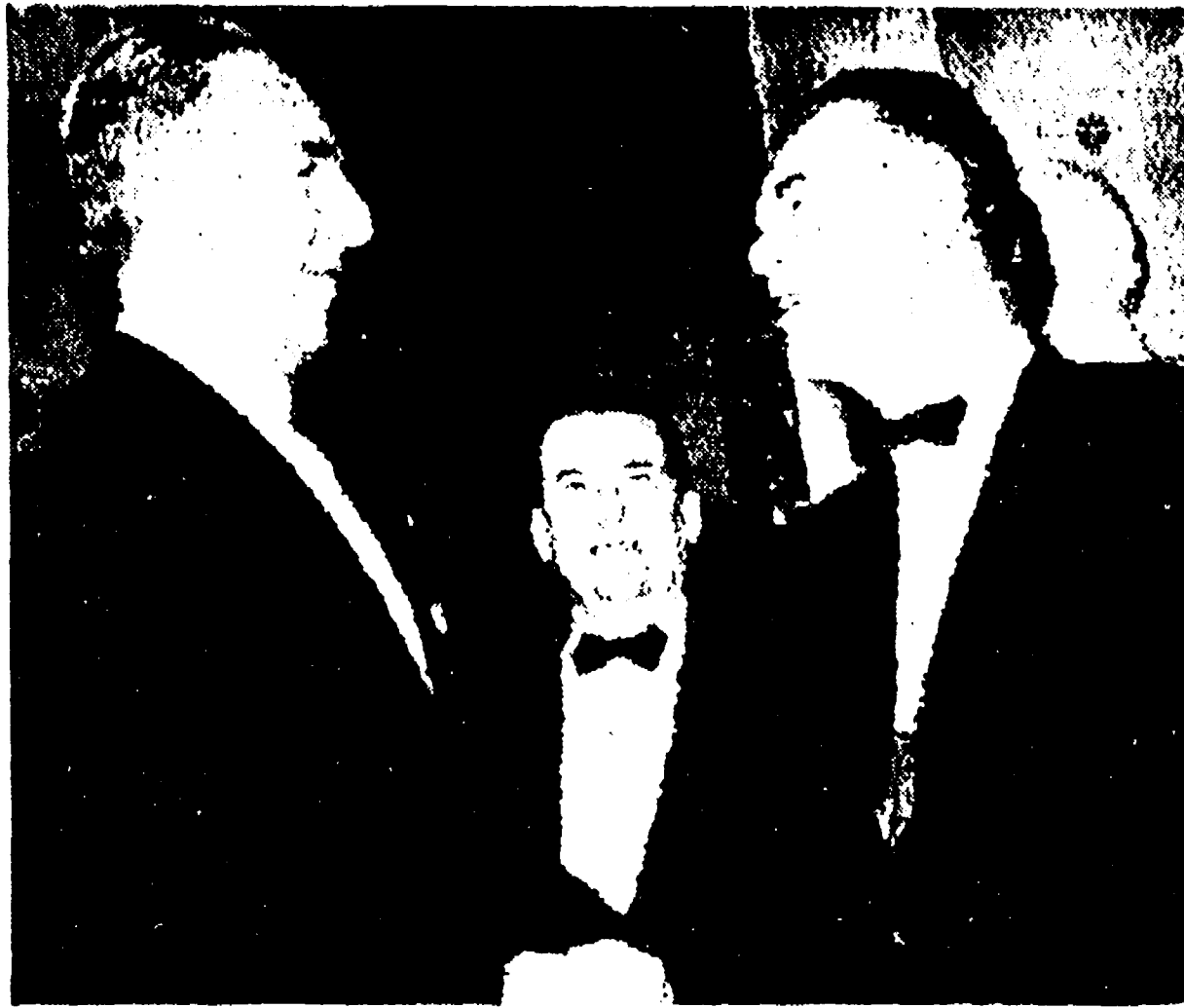
WASHINGTON, 4. - Il Consiglio della NATO ha concluso questa sera i suoi lavori con una dichiarazione che esprime accordo sulle "grandi linee" della politica da seguire nella trattativa con l'Unione Sovietica, ma ammette, riferendosi ai punti di vista delle grandi potenze interessate, il persistere di divergenze sulle questioni concrete. Il comunicato, che parla di "cerare nel negoziato" la soluzione dei problemi, non contiene a questo proposito indicazioni costruttive. Esso riafferma invece l'unanime determinazione di salvaguardare i diritti delle potenze alleate a Berlino.

Il comunicato in una conferenza stampa convocata subito dopo la fine dei lavori, il segretario della NATO, Spaak, ha ammesso che le potenze occidentali non hanno una posizione comune in vista della conferenza di Ginevra dell'11 maggio, ma ha detto che « senza dubbio per quella data il fronte unito sarà realizzato ». « Questa unità - Spaak ha soggiunto - si realizzerà soprattutto sulle posizioni che gli occidentali ritengono intangibili e sulle quali non saranno disposti a cedere ».