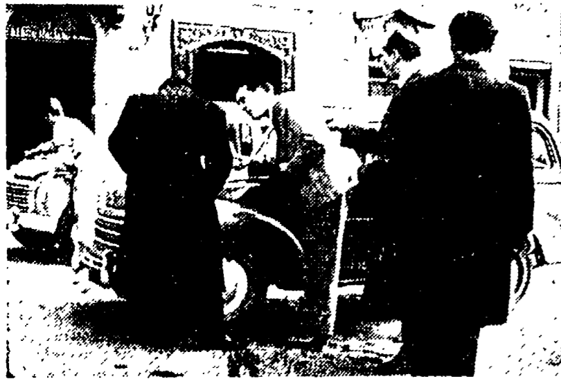
Contravvenzioni a «forfait»

Ci è stato riferito che le ultime disposizioni del Comando dei vigili urbani in materia di contravvenzioni sono state applicate a un numero di multe che una famiglia deve pagare al corso di un mese almeno 40. Se un padre non eleva almeno 40 contravvenzioni in 30 giorni, per gli ufficiali del Corpo di polizia urbana, non è un buon padre, e può venire punito con una multa di 40 mila lire, come ad esempio il trattamento di un altro. La notizia appare così incredibile, che se non fosse uscita da fonte autorevole, non l'avremmo nemmeno pubblicata. In occasione della visita di un'auto, proprio così. Un padre in servizio al Campidoglio, che non riesce a pagare le 40 multe, viene punito con una multa di 40 mila lire, per mancanza di contravvenzioni. La multa che non viene pagata, viene considerata come un debito, e viene aggiunta al debito precedente. In pratica, il padre deve pagare 40 mila lire, più le multe che non vengono pagate, e così via. La notizia è stata riferita da un funzionario del Comando dei vigili urbani, che ha detto che non è un buon padre, e può venire punito con una multa di 40 mila lire, come ad esempio il trattamento di un altro.