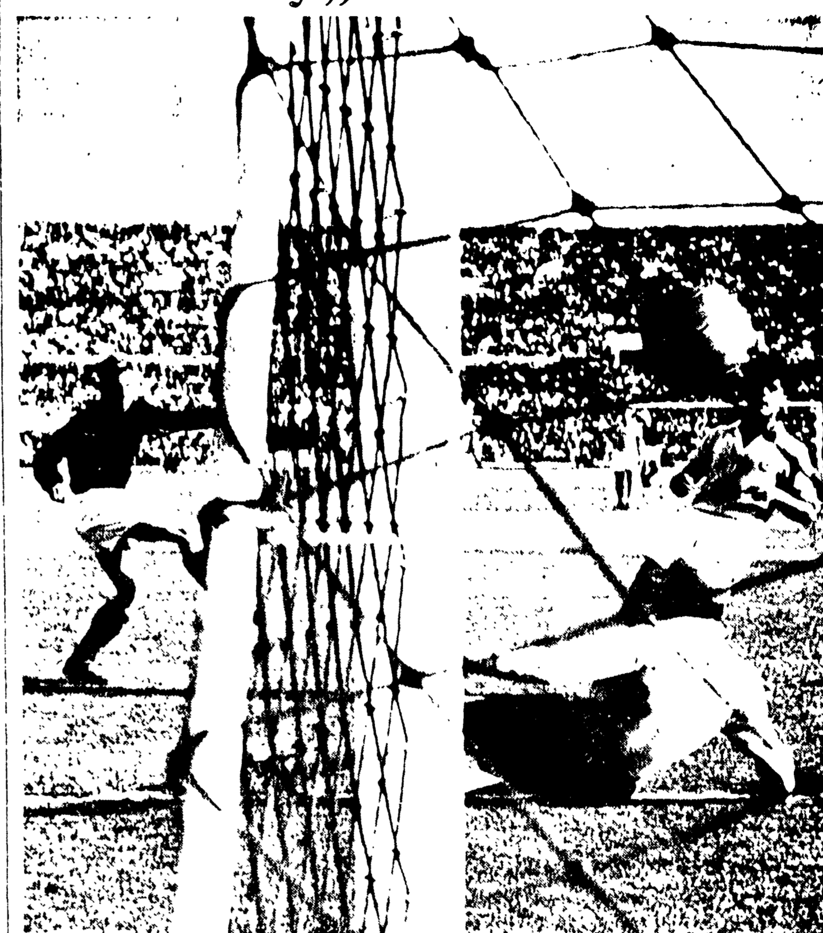
LA DOMENICA SPORTIVA è stata dominata dalla «partitissima» di Firenze vinta dai rossoneri (3-1) che al conseguimento sono tornati in testa alla classifica con un punto di vantaggio sul Lazio. Nel «derby» romano ha vinto la Roma per 1-0 mentre negli altri incontri si sono registrati il successo del Bari sulla Sampdoria, la sconfitta del Napoli a Ferrara, e le vittorie dell'Inter e del Triestina del Genoa e dell'Atalanta rispettivamente sul Bologna, sulla Fiorentina, sull'Alessandria, sul Padova e sul Torino. Nel diciannovesimo turno del campionato di Serie A il Lazio ha perso il secondo goal nel «derby» capitolino.