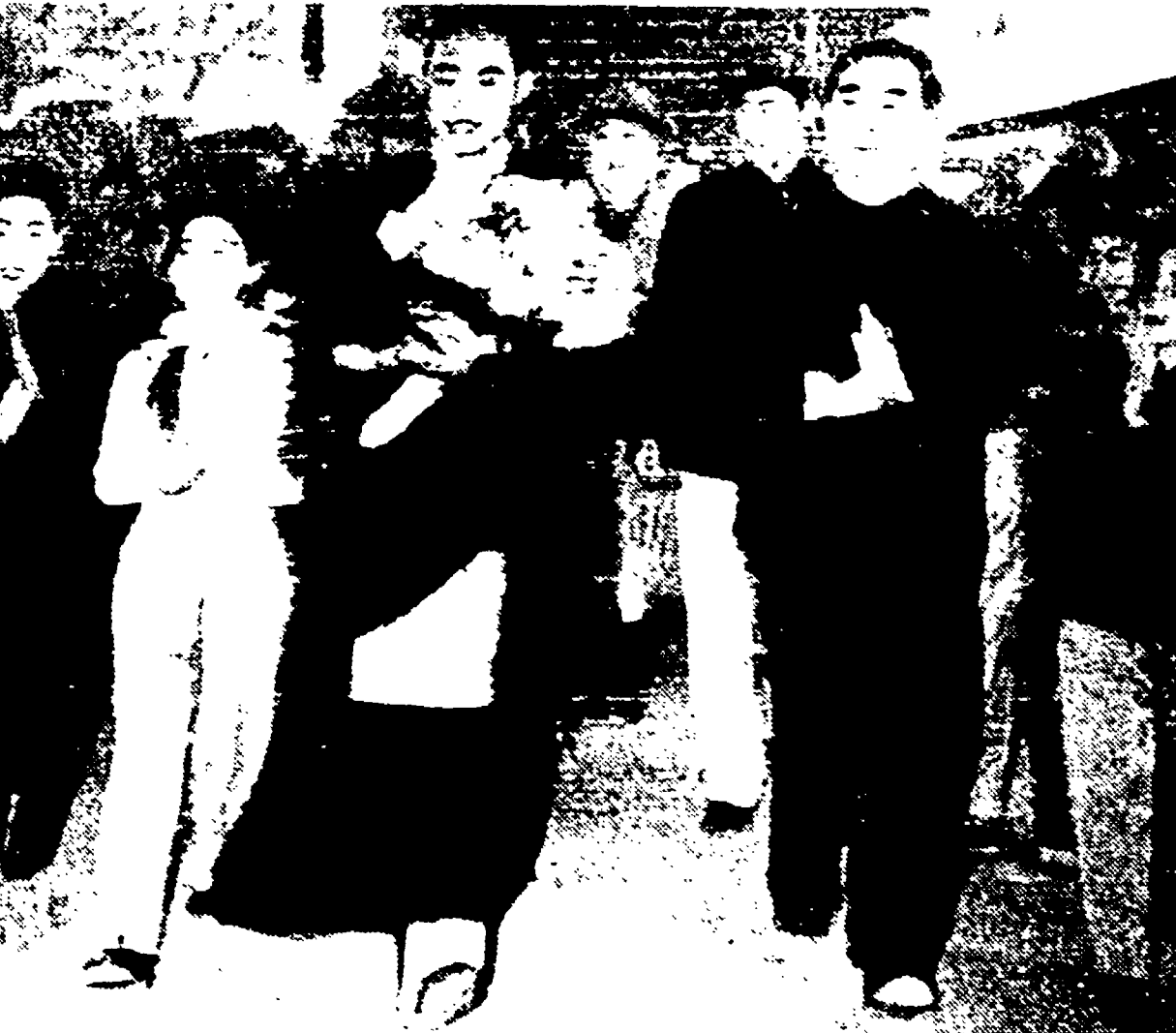
PECHINO — Il Pancen Lama, capo del comitato preparatore della Regione autonoma del Tibet è arrivato ieri a Pechino per partecipare alla prima sessione del Congresso nazionale del popolo, di cui egli è vicepresidente. Nella foto il Pancen Lama con un gruppo di fiori, mentre lascia la stazione di Pechino, accompagnato da Cui En Lai, che è andato ad onorarlo al suo arrivo.