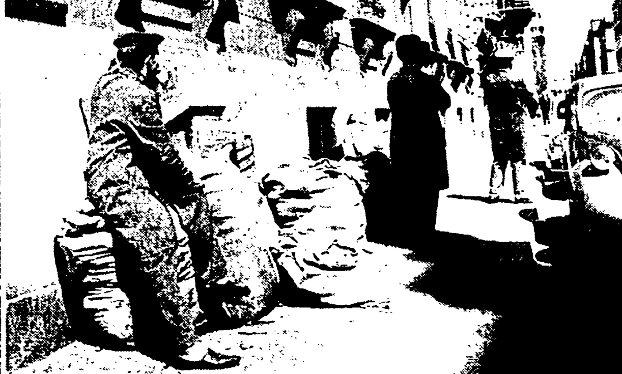
Le netturbine della V. Zona (Macao) da alcuni giorni sono in agitazione. Essi effettuano marce di protesta, hanno dimesso il personale togliendo un uomo per ogni squadra. La foto mostra lo scontro in atto in via Stella.