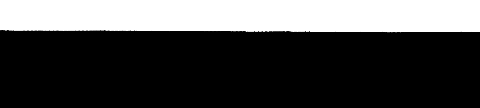
DEER LODGE (Montana, USA) - Il locale penitenziario da dove il direttore del carcere Floyd Powell esce dal cancello del penitenziario, dopo aver inutilmente tentato di trarre con gli insorti (disobbedienti in patria) i detenuti.