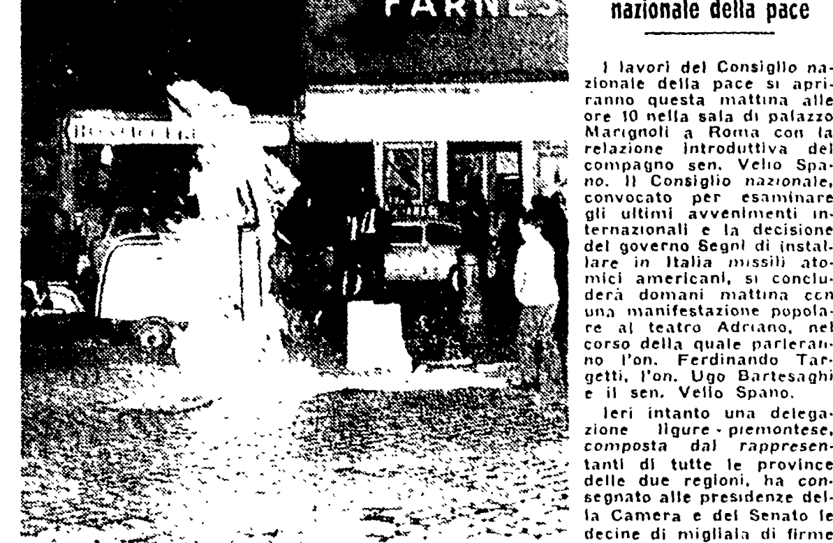
Una manifestazione contro l'installazione dei missili si è svolta ieri sera in piazza Campo de' Fiori a Roma. Un missile sottomarino è stato dato alle fiamme negli ultimi istanti. Altre persone sono state incendiate contemporaneamente da lanciati missili.

Ieri a Campo de' Fiori Oggi si riunisce a Roma il Consiglio nazionale della pace