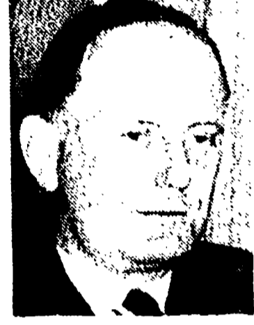
Il vicesegretario di Stato, Dillon, capo della delegazione americana a Wellington.

Nei giorni scorsi si è conclusa a Wellington (Nuova Zelanda) la conferenza della SEATO, l'organizzazione militare dell'Asia sud-orientale costituita sotto il controllo degli Stati Uniti, che include, oltre alle potenze occidentali, Australia, Nuova Zelanda, Pakistan, Thailandia e Filippine.