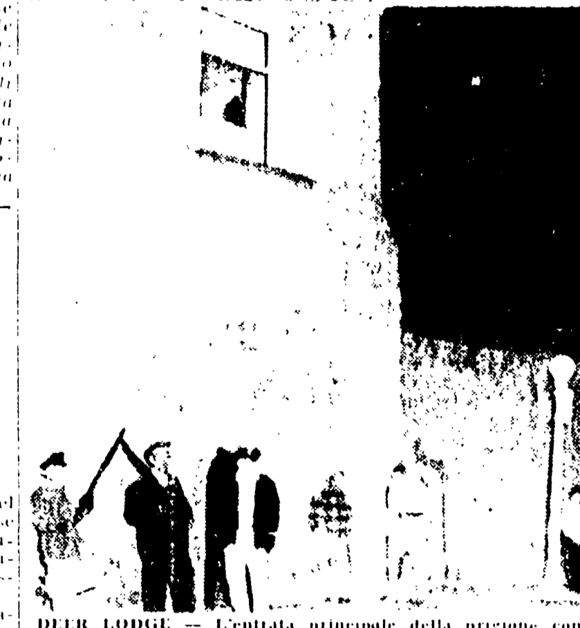
DEER LODGE. L'entrata principale della prigione, con la torre, unica zona del penitenziario controllata dalle autorità.

(Nostro servizio particolare) DEER LODGE, 17. — Una violenta rivolta e scoppio di una lotta di detenuti, imprigionati nelle carceri di Deer Lodge, nel Montana. Una lotta di detenuti, imprigionati nelle carceri di Deer Lodge, nel Montana.