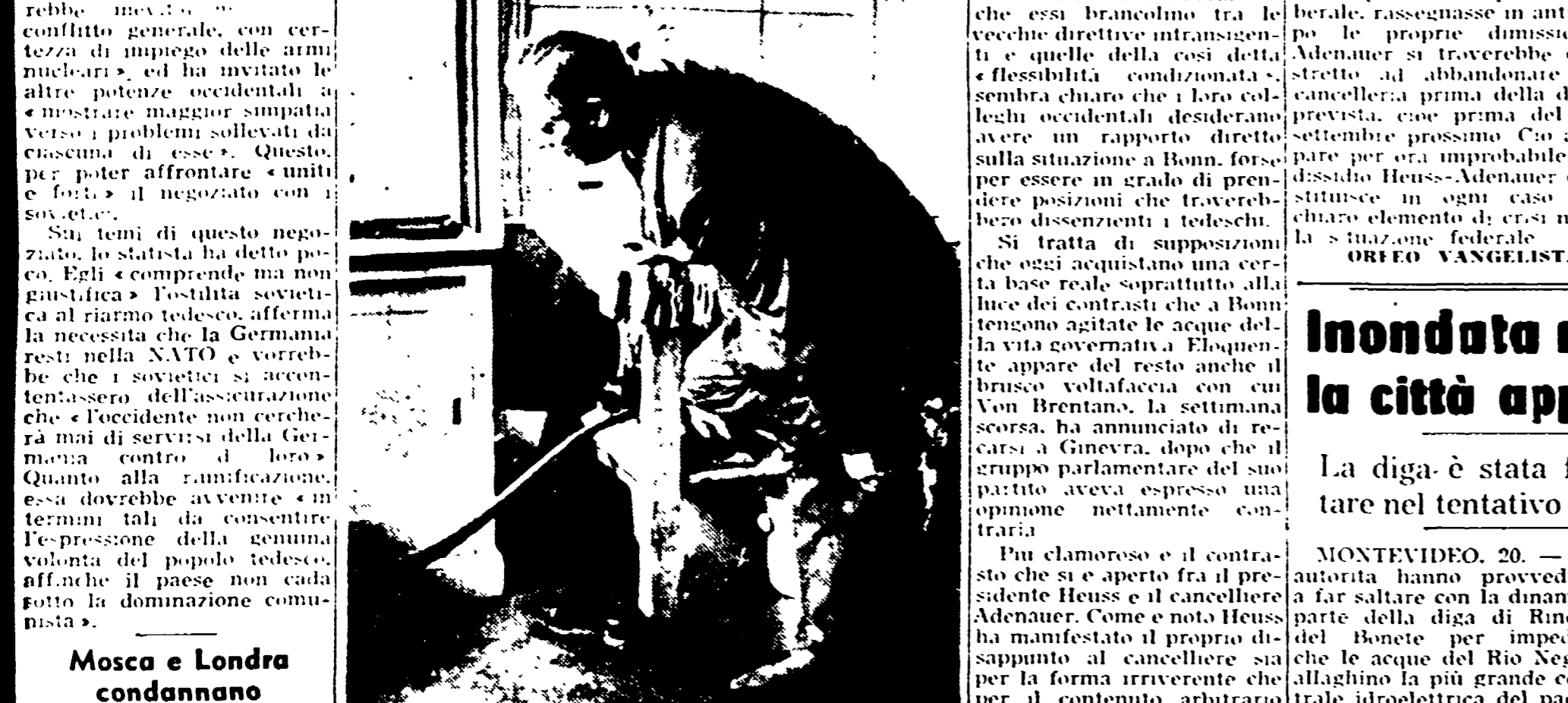
BIRCH GROVE (Sussex) — Una singolare immagine del primo ministro inglese Macmillan nella sua casa di campagna del Sussex. Il fotografo ha ritratto, infatti, il premier inglese appena rientrato nella sua villa mentre si toglie le scarpe infangate e con i pantaloni rimbombati. La casa di campagna di Birch Grove è stata aperta al pubblico a pagamento a beneficio di un locale istituto.

MOSCA, 20. — In una nota consegnata dal ministro degli Esteri sovietico Gromyko giovedì scorso all'ambasciatore norvegese a Mosca e resa nota ieri sera, l'Unione Sovietica avverte la Norvegia delle «pericolose conseguenze» derivanti dal consentire lo stabilimento di basi della NATO nel suo territorio.