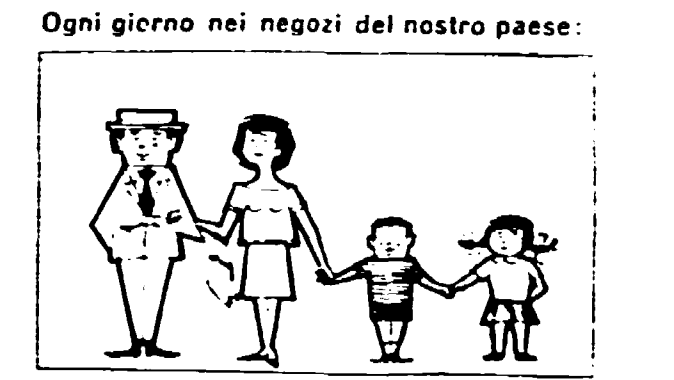
Ogni giorno nei negozi del nostro paese: quasi 600.000 famiglie acquistano un pacchetto da gr. 100 di margarina.

ASSOCIAZIONE NAZIONALE INDUSTRIALI MARGARINA