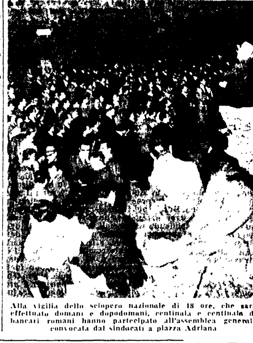
Alla vigilia dello sciopero nazionale di 18 ore, che sarà effettuato domani e dopodomani, centinaia di bancari romani hanno partecipato all'assemblea generale convocata dai sindacati a piazza Adriana.