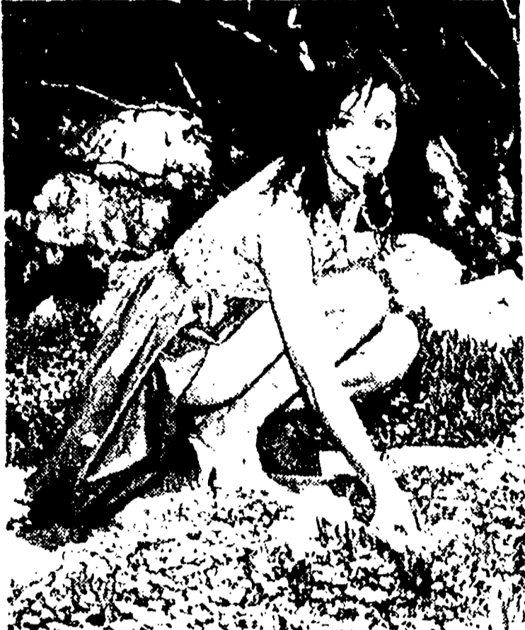
CANNES. — Continua sulla Riviera la esposizione delle...