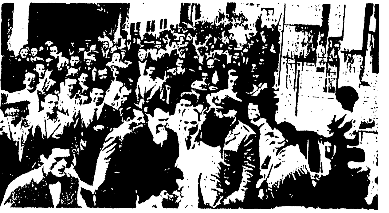
ABBADIA S. SALVATORE. - Oggi tutto il popolo di Abbadia S. Salvatore partecipa ad una grande giornata di lotta, tutti i sindacati hanno infatti proclamato un'astensione dal lavoro in solidarietà con i minatori della miniera di Amiata. In alto: una manifestazione di solidarietà con i minatori. In basso: una recente manifestazione popolare di solidarietà con i minatori.