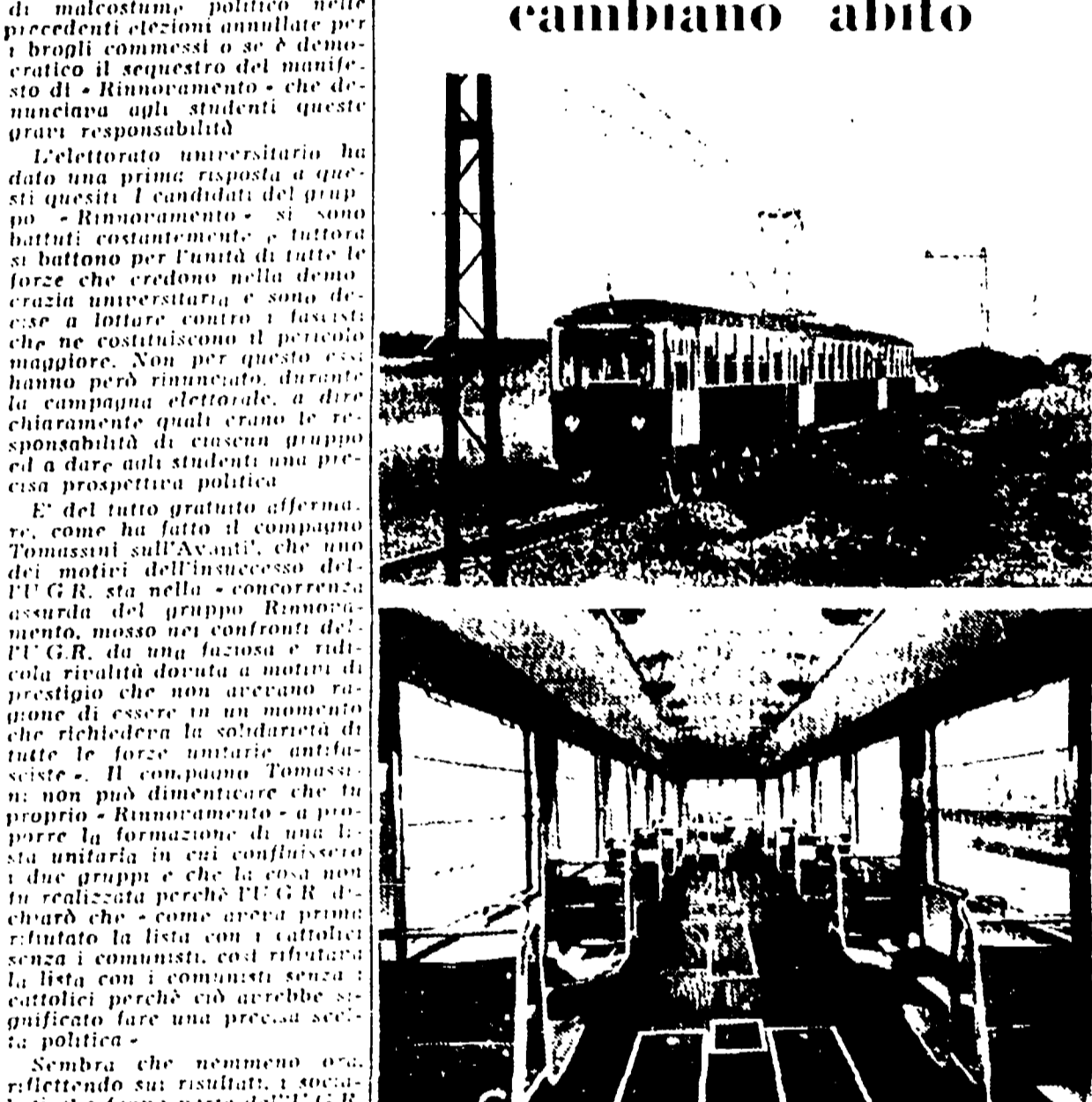
In alto: una vecchia vettura. In basso: l'interno di una delle carrozze rinnovate.