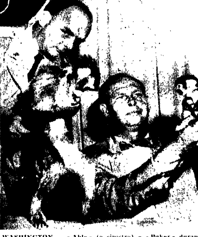
WASHINGTON — « Able » (a sinistra) e « Baker » durante la conferenza stampa.

ALFREDO REICHLIN direttore Enza Barberi direttore resp. iscritto al n. 243 del Registro Stamps del Tribunale di Roma. T. UNITA' - autorizzazione a giornale murale n. 4555. Stabilimento Tipografico G. A. T. E. Via del Taurini, n. 19 - Roma. S. 21363 F.