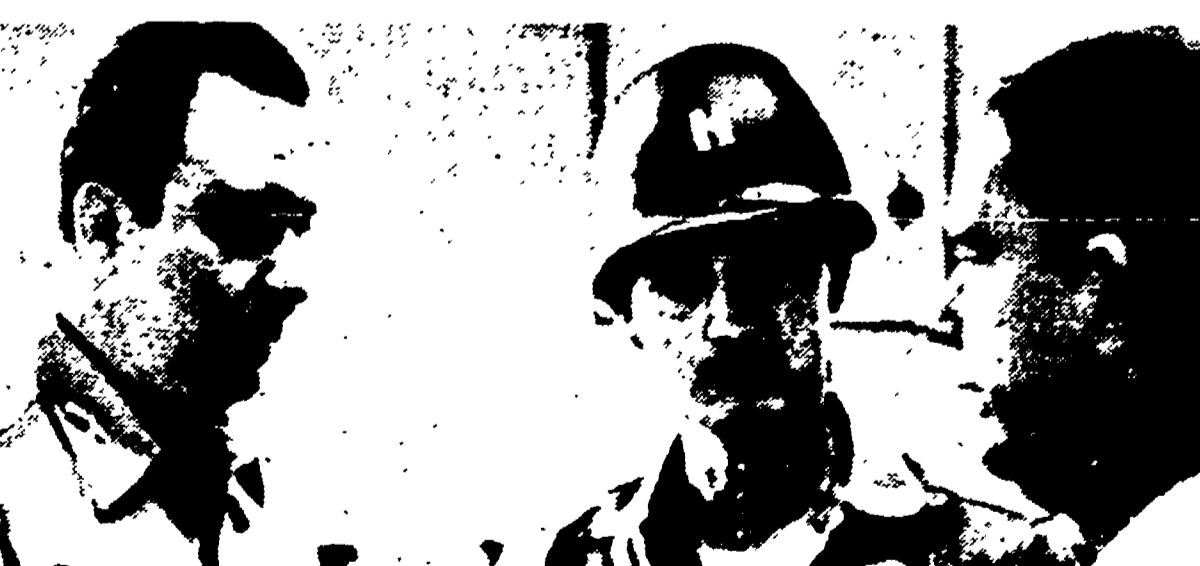
MANAGUA. - Un giornalista (a destra) intervista Anastasio Somoza, fratello del dittatore e capo delle forze armate (a sinistra) e il capitano Gutierrez, capo della guardia nazionale (Telefoto)

In tutti i paesi dell'America Latina cresce il movimento di solidarietà con gli insorti. Gli esuli chiedono ai rimpatriare e si mettono in contatto con i comandi insurrezionali all'estero per entrare a far parte dei contingenti di sbarco.