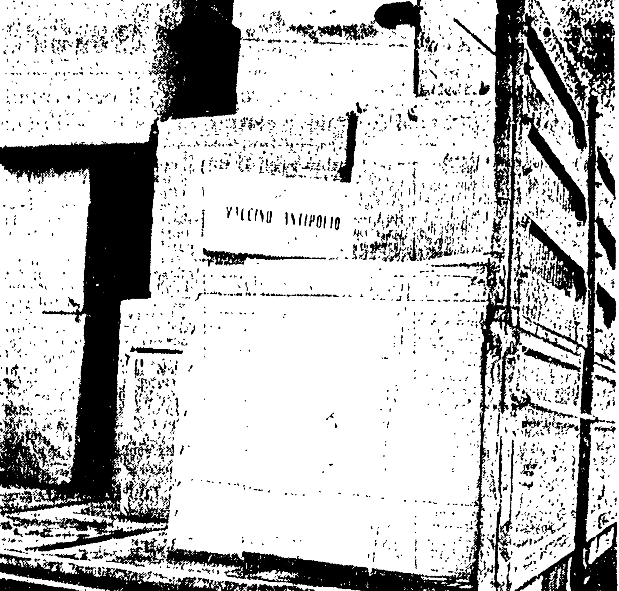
SULMONA — Ecco come venivano trasportate le casse contenenti l'antipolio, altro che le celle frigorifere di cui parlava il Ministro della Sanità

Il ministro della Sanità aveva invece assicurato che «tutti i trasporti di vaccino avvenivano con le precauzioni necessarie a non fargli perdere l'efficacia»