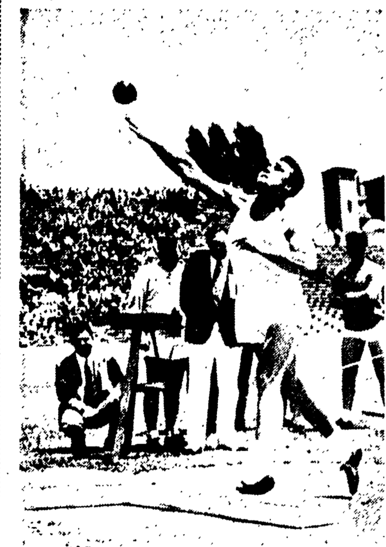
POMONA. 17. - Dopo numerosi tentativi infruttuosi, Perry O'Brien ha finalmente migliorato ieri sera il suo record mondiale del lancio del peso. Egli ha lanciato l'attrezzo a 63 piedi e 6 pollici e a m. 19,40.