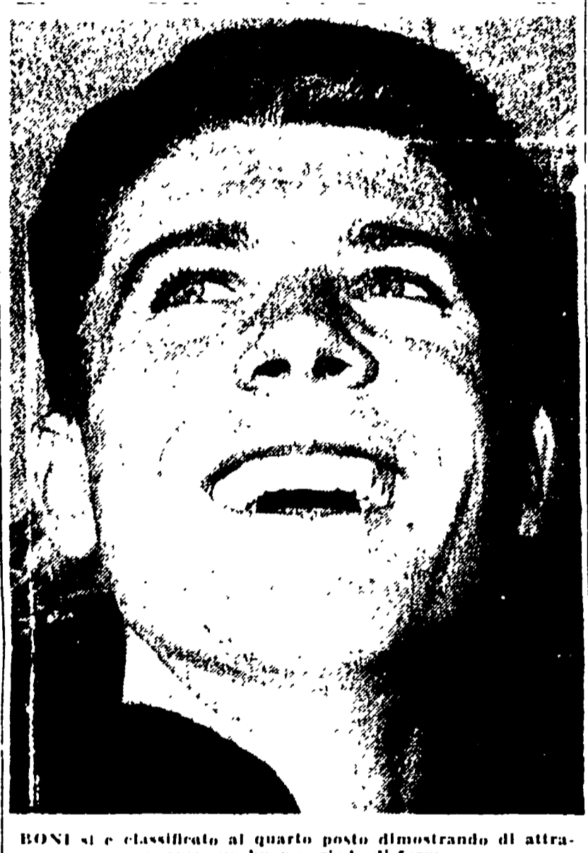
BONI si è classificato al quarto posto dimostrando di attrarre un buon periodo di forma...