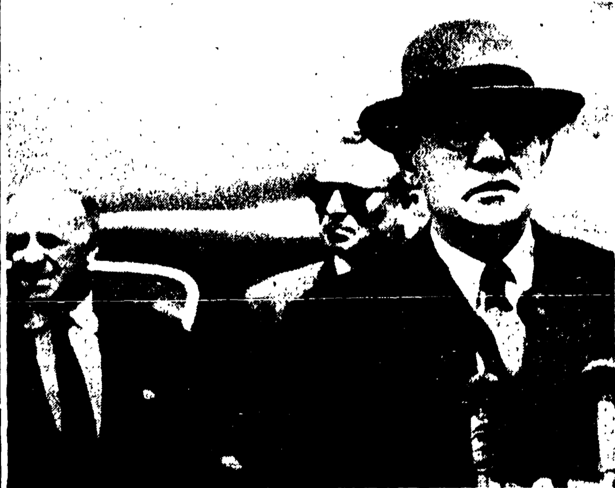
GINEVRA - Gromko di fronte al microfono pronuncia il suo discorso subito dopo l'arrivo nella città svizzera per la ripresa della conferenza dei ministri degli Esteri.

(Dal nostro inviato speciale) GINEVRA, 11. - Gromko e Von Brentano sono giunti a Ginevra i primi due sono arrivati nella mattinata. Von Brentano nel pomeriggio. Gli altri ministri degli esteri arriveranno domani.