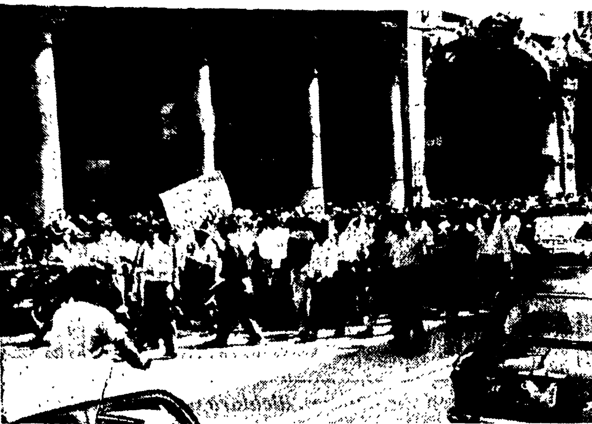
Lo sciopero dei metallurgici è proseguito compatto per tutta la giornata. A Genova la percentuale di astensioni ha raggiunto il 95%. La PION si è rifiutata di firmare l'accordo proposto dalla direzione della SCI di Corigliano, accettato dalla CISL e dalla UIL, giudicandolo solo un espediente per eliminare dalla lotta una delle più importanti fabbriche italiane ed indebolire la lotta dei lavoratori sul piano nazionale.

L'accordo, infatti, prevede nel complesso un aumento medio di sole 2.100-2.600 lire mensili, e quindi non è da ritenersi soddisfacente se al fine del soddisfacimento delle rivendicazioni aziendali né a quello della lotta nazionale per il rinnovo del contratto.