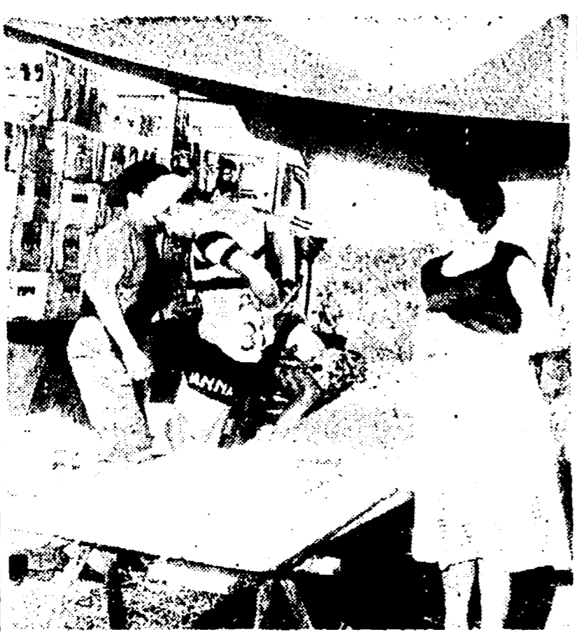
Il caldo soffocante dei giorni scorsi ha costretto gli uomini del "Tour" ad una disperata caccia alle fontane e qualunque altra cosa che desse un po' di refrigerio. La foto mostra due ragazzi al lavoro - l'obiettivo questa volta è una fontana di ghiaccio. Il caldo continua a dominare la corsa e rallentare il passo dei capitani e dei rincalzati anche oggi?

ST. ETIENNE, 12 - Sul tramonto di St. Etienne non abbiamo avuto il piacere di vedere compiere la sfilata onore all'uomo - psicht - Non c'era stata lotta, ed il premio per l'uomo più combattuto della tappa non è stato assegnato. Dispetto, rabbia dell'organizzazione.