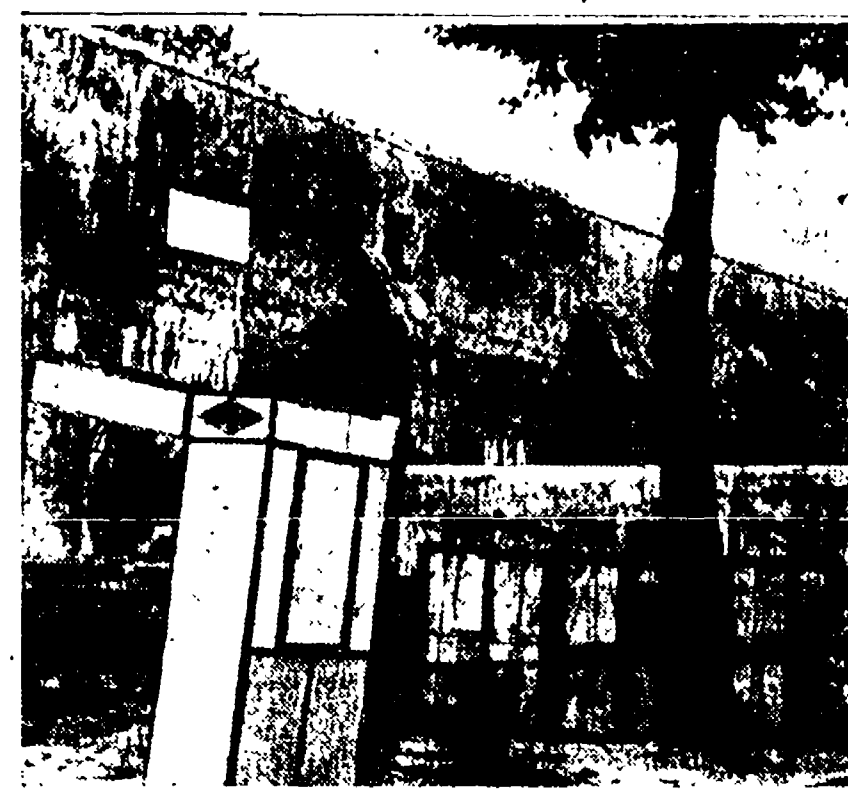
Uno dei muri che sbarrano al traffico la via Ascianghi

la naturale al viale Trastevere dal ponte Palatino fino al ministero della Pubblica Istruzione, evitando tutta l'attuale congestione del traffico che attraversa il rione fino e dal ponte Garibaldi. Ma ammesso per assurdo che non servisse a niente (neppure a zona di parcheggio), sarebbe la trasvolante di una cessione fatta così alla brava a un istituto che - come ha notato Giolitti - può avere mille bonemerite, ma che non può pretendere che il Comune distrugga a suo favore una strada pubblica.