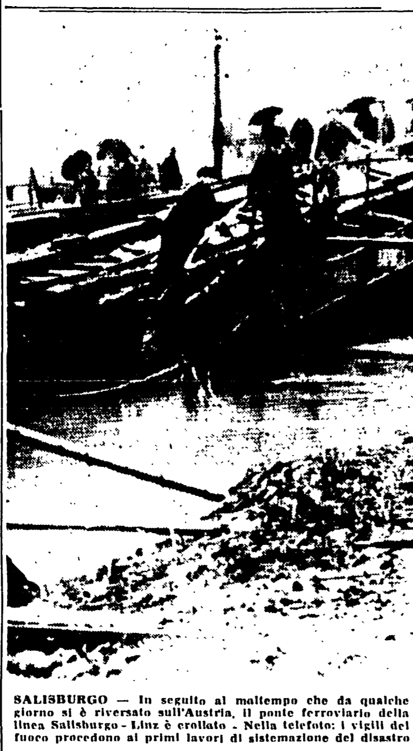
SALISBURGO - In seguito al maltempo che da qualche giorno si è riversato sull'Austria, il ponte ferroviario della linea Salisburgo - Linz è crollato. Nella telefoto: i vigili del fuoco procedono ai primi lavori di sistemazione del disastro