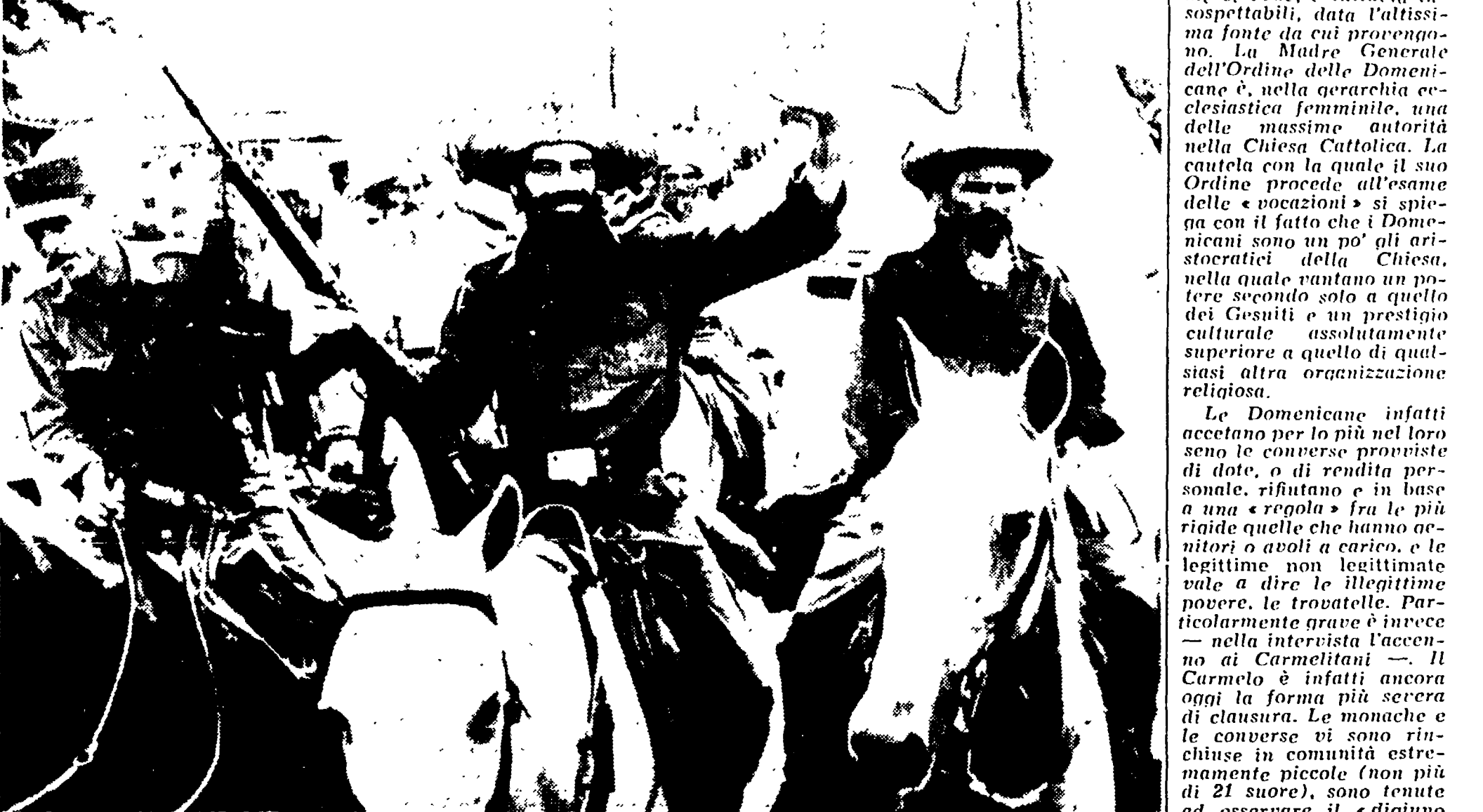
LAVANA - Il giornale ufficiale cubano ha pubblicato ieri un decreto...

« Cosa significhi quel « girare e prenderle su, e di portarle in convento, poi se di cento ne restan dieci, pazienza... »