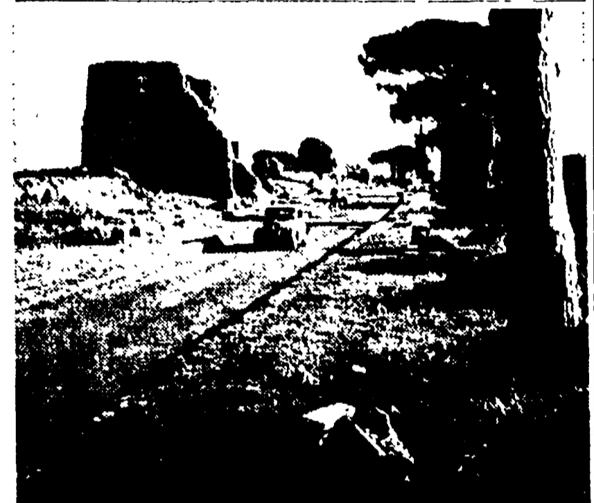
Una immagine dell'Appia Antica

Dopo una breve relazione sui lavori svolti dalla commissione dal 1954 sino ad oggi, l'anziano scultore, il direttore Zanotti Bianco, ha preso la parola il ministro Medici il quale ha detto tra l'altro che il piano paesistico comprende l'espansione della zona di interesse alla via Appia e ai più insigni monumenti archeologici.