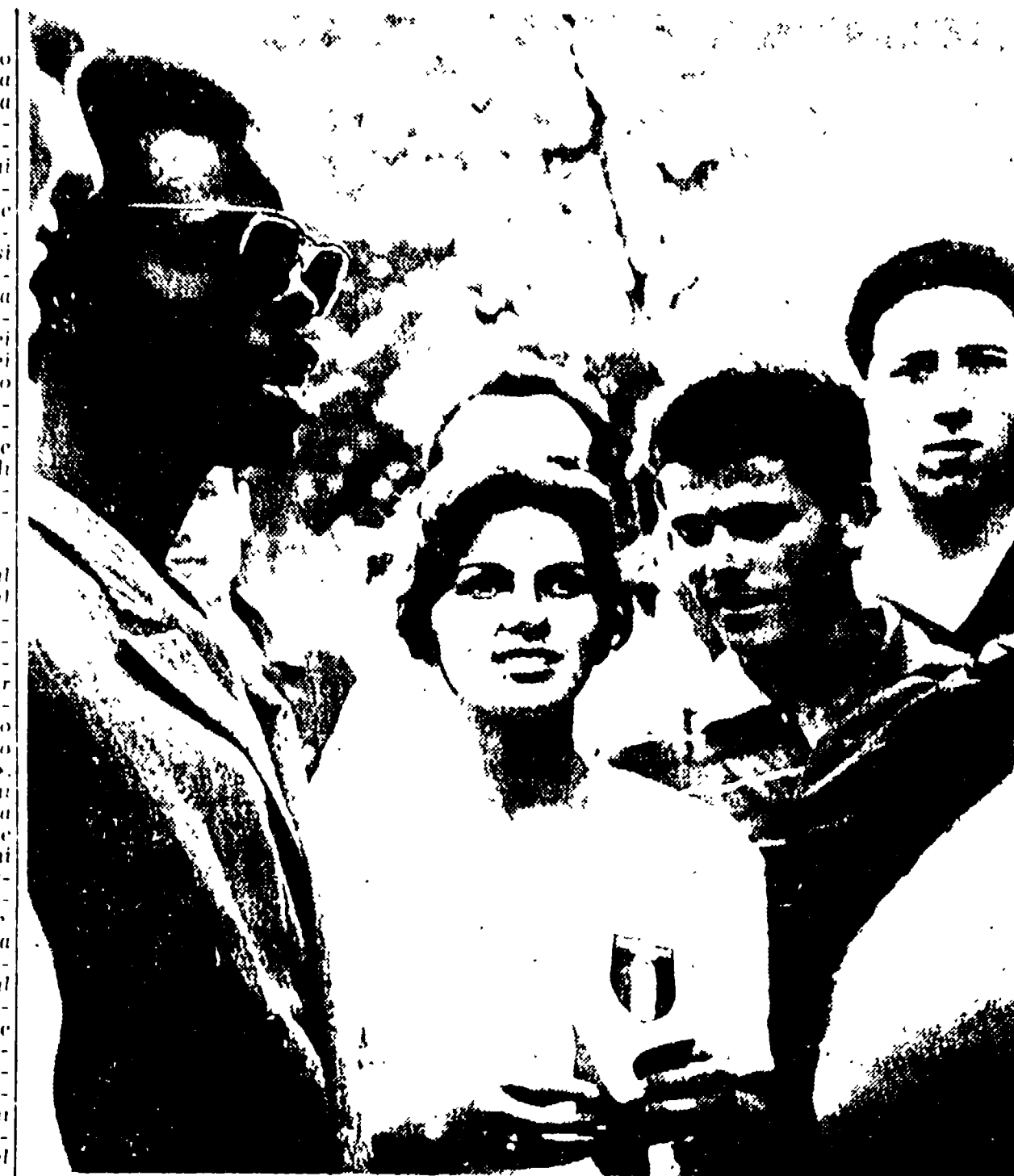
VIENNA - Incontri di giovani al Prater durante il Festival

VIENNA, 30. - Al Porto d'Inverno, sul Danubio, una folla rappresentanza della delegazione italiana presieduta dal festival di gioventù ha reso la sua visita ai delegati della repubblica rumena. La vita sulla grande scialuppa dove è stato allestito il campaggio rumeno si svolge regolarmente, in piena libertà. La stessa cosa avviene sulle navi dei polacchi, degli jugoslavi, dei bulgari, e nel campaggio dei ceoslovacchi. Chiunque può accedere alle navi o ai campaggi, intrattenersi coi vari delegati: accolti sempre e ovunque con sentimenti di profonda amicizia, con perfetta ospitalità, come gli italiani hanno potuto personalmente sperimentare.