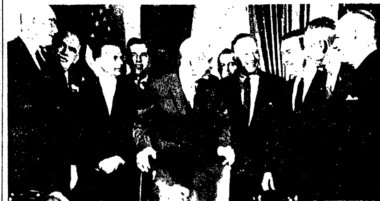
WASHINGTON - Il Presidente Eisenhower riceve i governatori americani di ritorno dal loro viaggio in Unione Sovietica.

Nel suo discorso alla radio e alla televisione il vice presidente degli Stati Uniti rende omaggio al lavoro creativo e al desiderio di pace dell'URSS - "Lavoreremo senza sosta per la pace,"