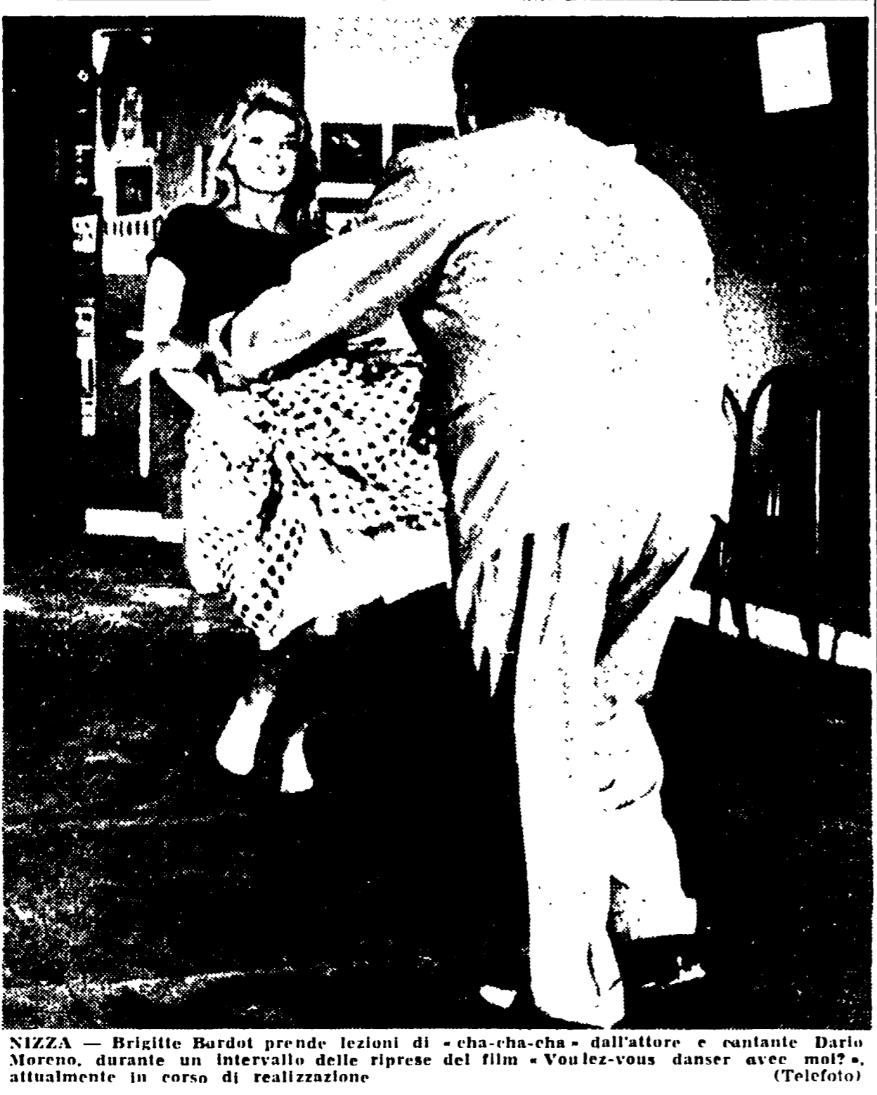
NIZZA — Brigitte Bardot prende lezioni di « cha-cha-cha » dall'attore e cantante Danilo Moreno, durante un intervallo delle riprese del film « Voulez-vous danser avec moi? », attualmente in corso di realizzazione.