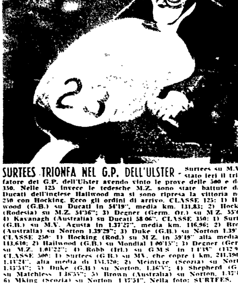
SURTEES TRIONFA NEL G.P. DELL'ULSTER - Surtees su M.V. e vince il premio di categoria

Mezzofondo professionisti I primi quattro entrano in finale. PRIMA BATTERIA 1) Sacchi (It.); 2) Yashida (Giap.). SECONDA BATTERIA 1) Sacchi (It.); 2) Yashida (Giap.). QUINTO DI FINALE 1) Sacchi (It.); 2) Yashida (Giap.). SECONDA BATTERIA 1) Sacchi (It.); 2) Yashida (Giap.).