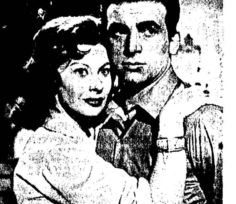
Una scena del commedia film "N9 SIAMO DUE EYASI" che appare in questi giorni negli schermi romani. Il film, che è l'ultima fatica cinematografica di Ugo Tognazzi, è interpretato anche da Raimondo Vianello, Magali Noël e da Maurizio Arena ed è stato prodotto da Dario Sabatello - Distr. Cineriz

Un film di grande successo tedesco, e di grande successo anche in Italia, con una storia di produzione tedesca, con una storia di produzione tedesca, con una storia di produzione tedesca.