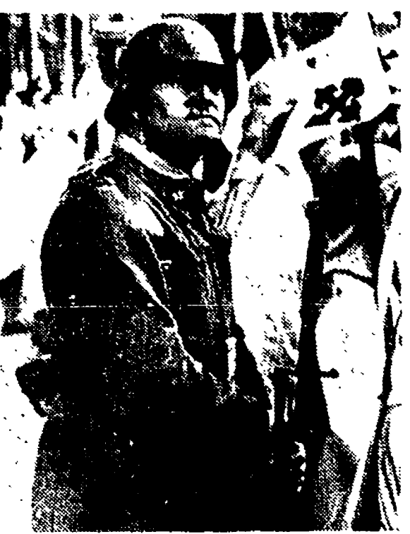
DOMANI il primo reportage del nostro inviato Rubens Tedeschi nella penisola iberica

«...Come in Italia alla vigilia del 25 luglio il malcontento è arrivato ormai al suo culmine. Il giorno in cui un'occasione qualsiasi aprirà la via a un rivolgimento, ci si accorgerà facilmente che anche qui, più ancora che nell'Italia fascista, il regime ha perso ogni base di massa...»