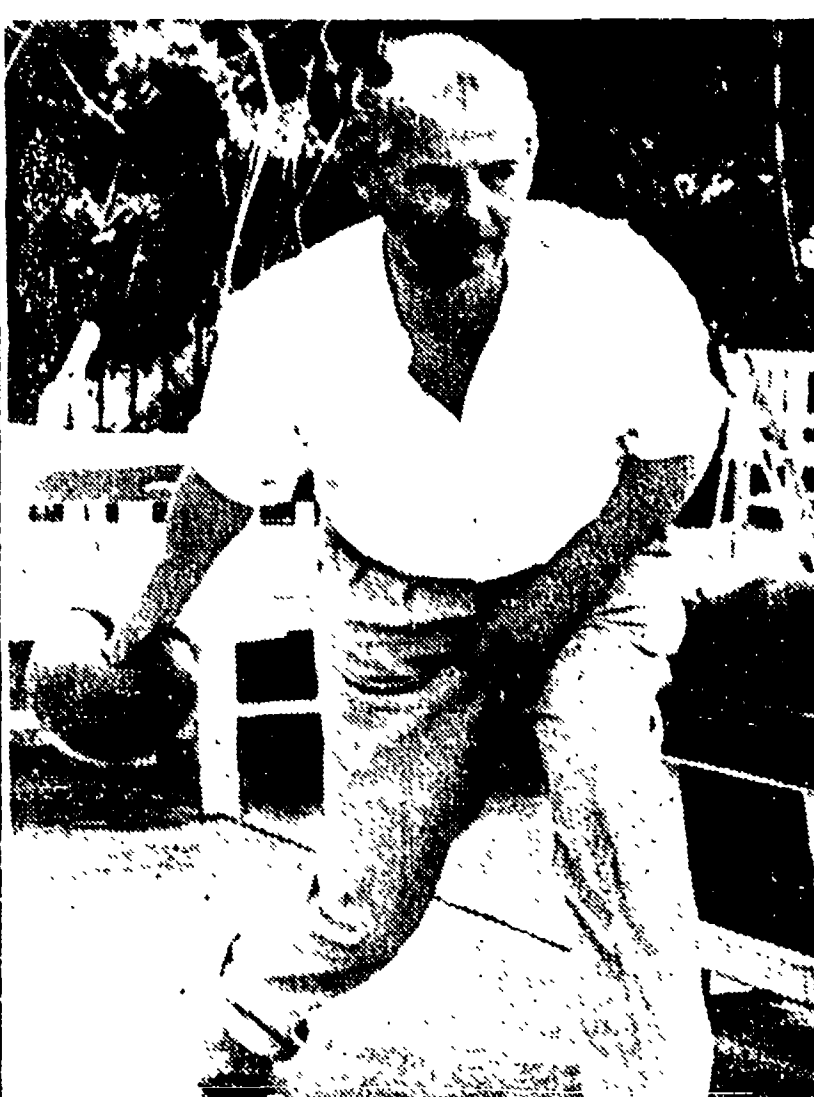
S. AGARO - Il ministro degli Esteri inglese, Selwyn Lloyd, non sembra molto preoccupato dalle recenti proteste francesi contro l'Inghilterra...