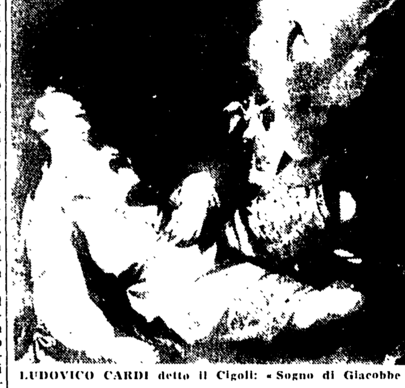
LUDOVICO CARDI detto il Cigoli: «Sogno di Giacobbe»