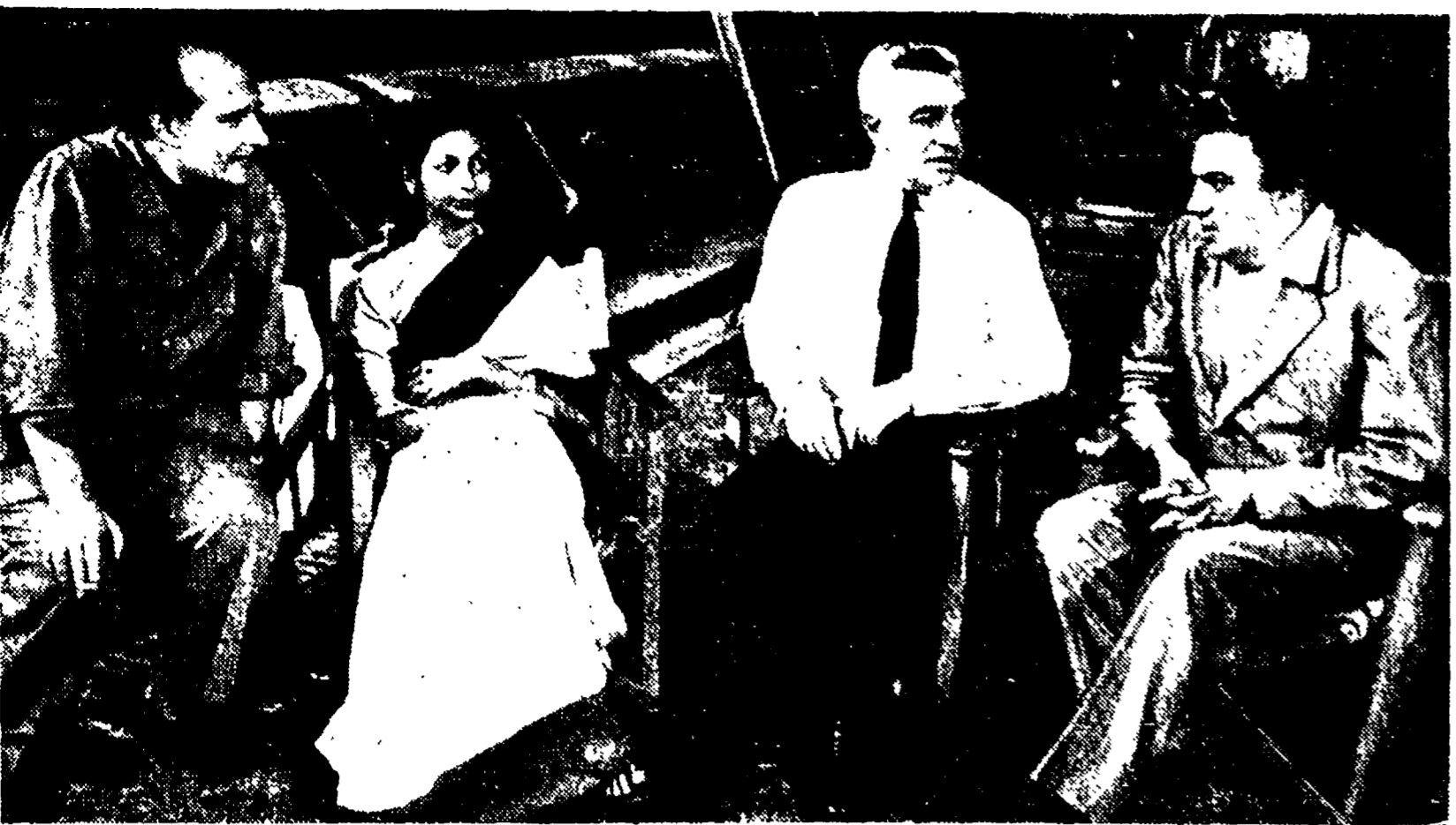
La XX Mostra internazionale d'arte cinematografica prende il via...