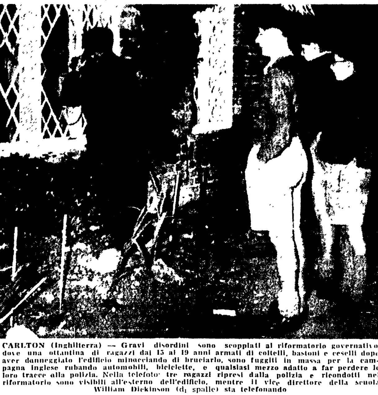
CARLTON (Inghilterra) - Gravi disordini sono scoppiati al riformatorio governativo, dove una trentina di ragazzi dai 15 ai 19 anni armati di coltelli...

ni che hanno fatto finora estere il capitale privato ad impegnarsi per la realizzazione del famoso piano di Costantina.