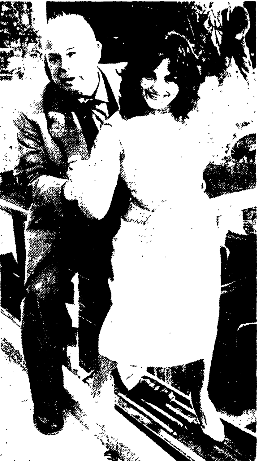
Il regista francese Jean Renoir presenta a Venezia con la sua nuova scoperta, la mariseglia Catherine Rouvel...