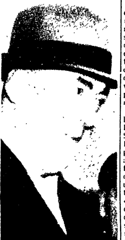
Il primo ministro polacco Cyrankiewicz