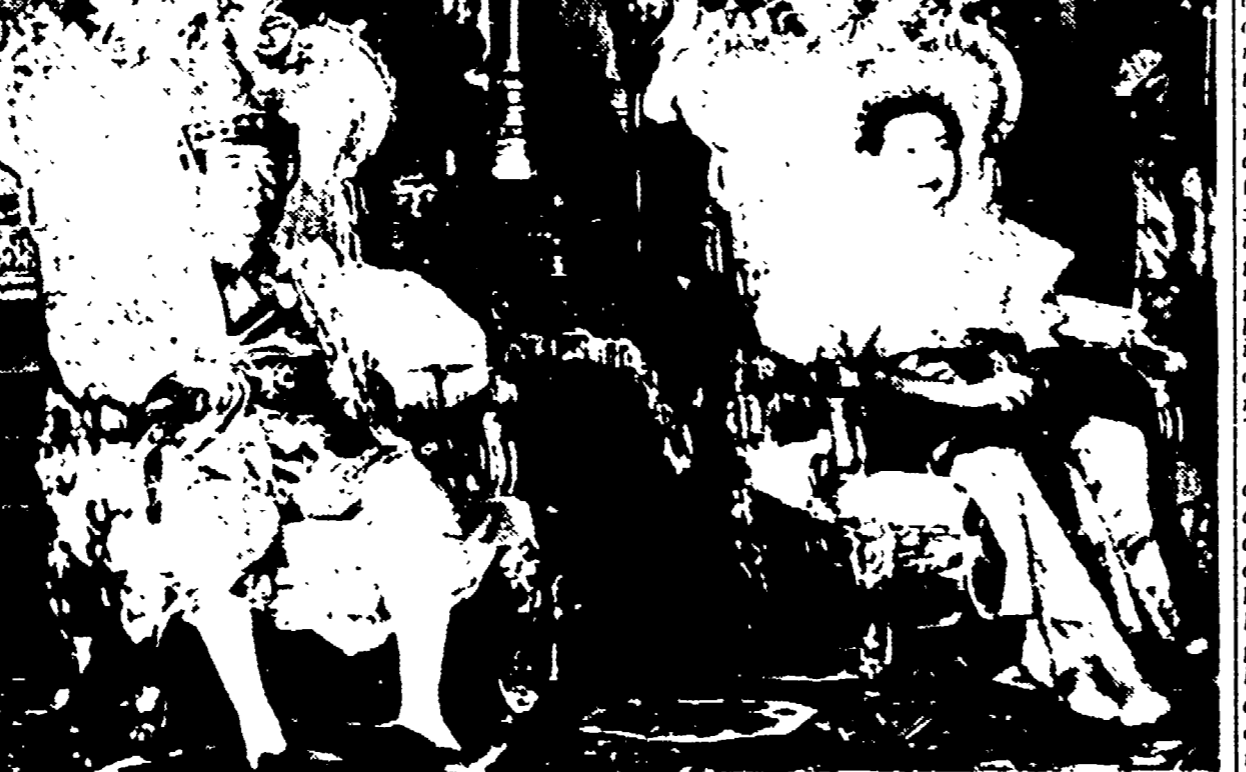
PNOMPENH - Il re di Cambogia Norodom Sumararit e la regina Sisowath Kossanak sul trono durante una recente cerimonia ufficiale

I reali sfuggono all'attentato che uccide il loro figlio principe Vakravin