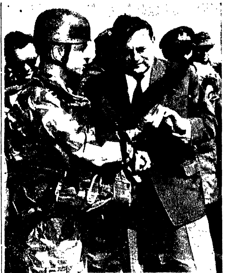
U.L.M. — Il ministro della difesa della Germania di Bonn Strauss osserva un mitra di nuovo tipo che gli viene presentato da un paracadutista tedesco in tenuta da guerra. La scena è stata ritratta durante la grande manovra dell'esercito tedesco alle quali partecipano 18.000 soldati tedeschi e il 350. Reggimento di artiglieria americano (Telefoto)

LINZ. 3 — Un amante respinto ha investito oggi la donna del cuore con la propria macchina quando essa stava per scappare in un'auto con sei colpi di pistola.