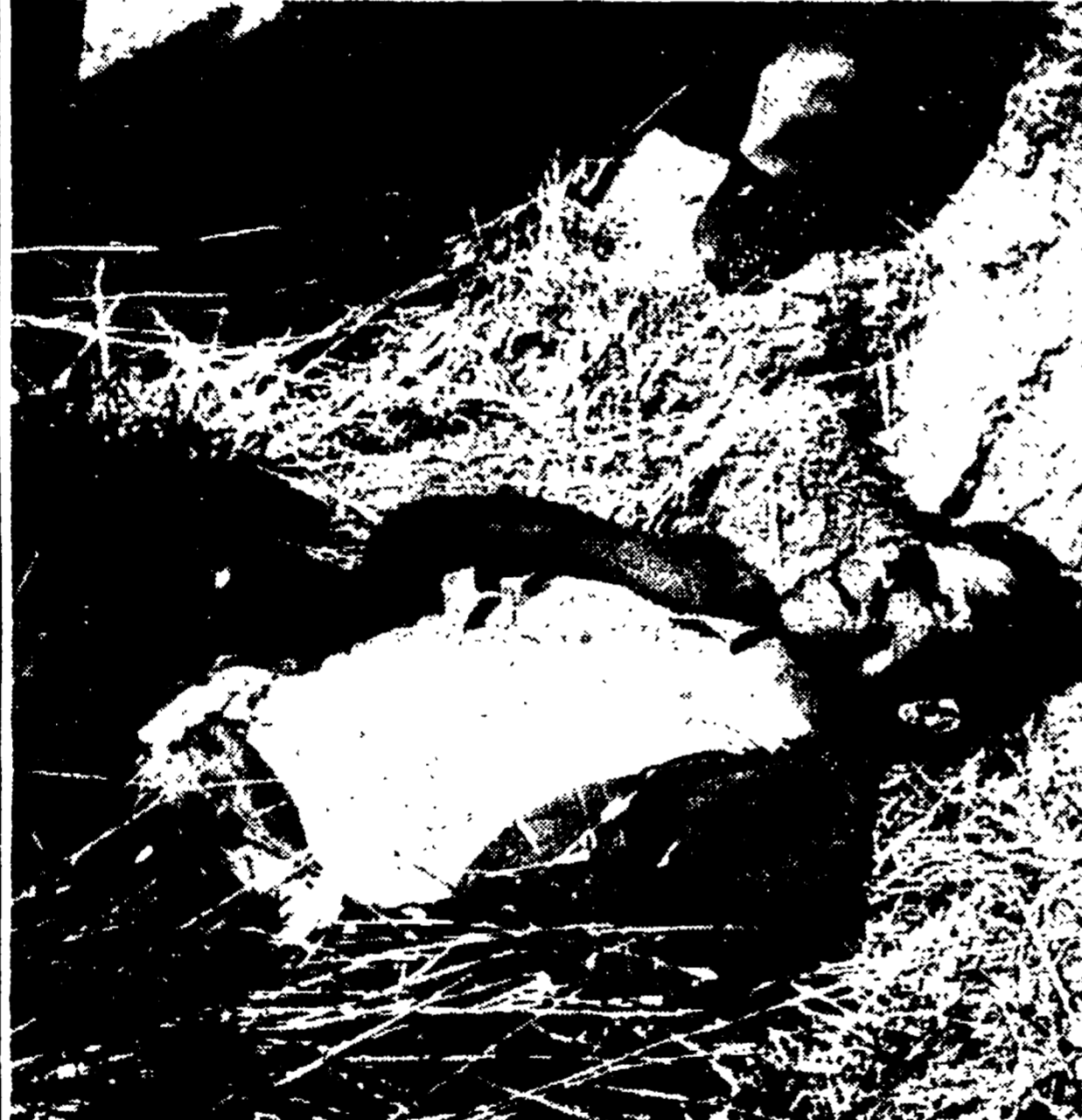
PALERMO - Un carabinieri caduto insieme ad altri automobilisti in un agguato di banditi sulla strada di Corleone, ha reagito alla aggressione ingaggiando un conflitto con gli assaltatori. Egli ne ha feriti due, uno dei quali mortalmente, una volta che ha dato fuoco ai malviventi che l'hanno fucilato a fucilate. Nella foto: il corpo del bandito ucciso dal carabinieri, rinvenuto dopo alcune ore ad alcuni chilometri dal luogo dello scontro.

UNA LETTERA DEI PARLAMENTARI COMUNISTI E SOCIALISTI DI FIRENZE