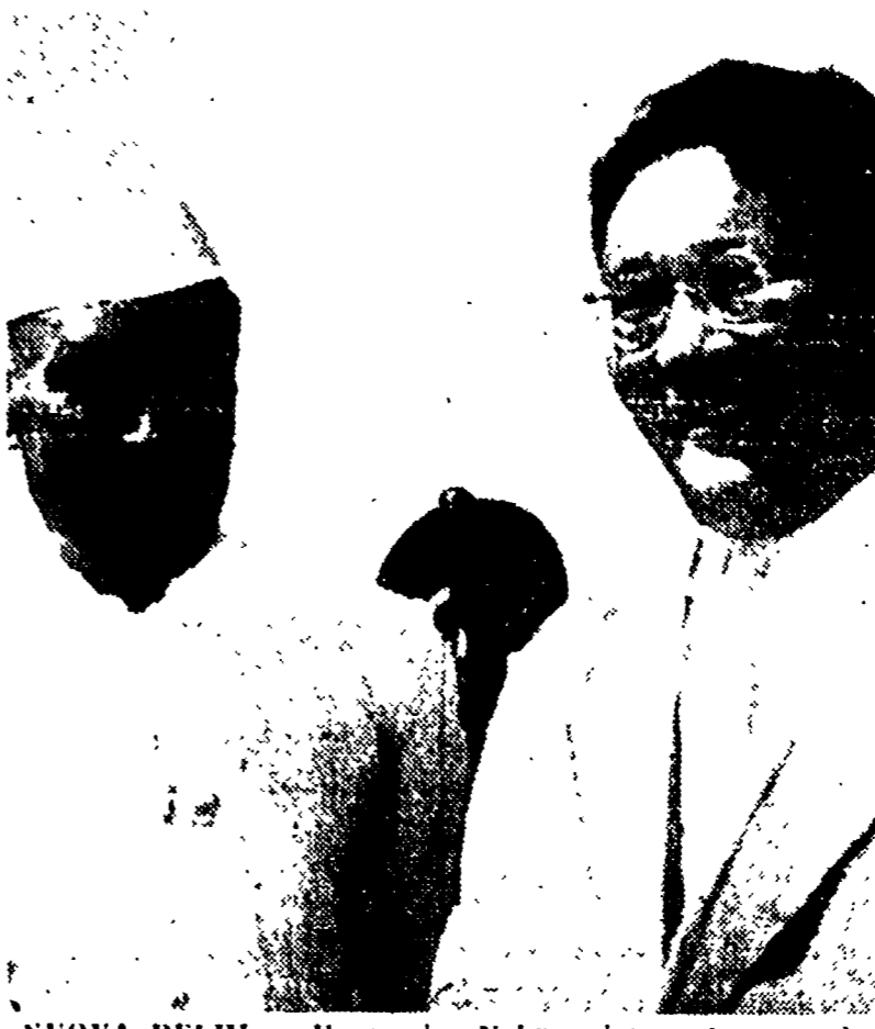
NUOVA DELHI. 10. — Il premier Nehru, riceve al suo arrivo a Delhi il premier della Mongolia Tse-denbal.