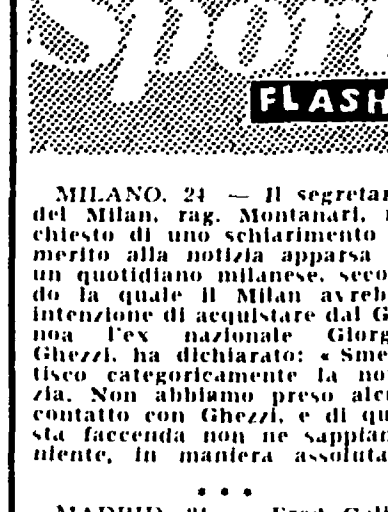
MILANO, 24. — Il segretario del Milan...