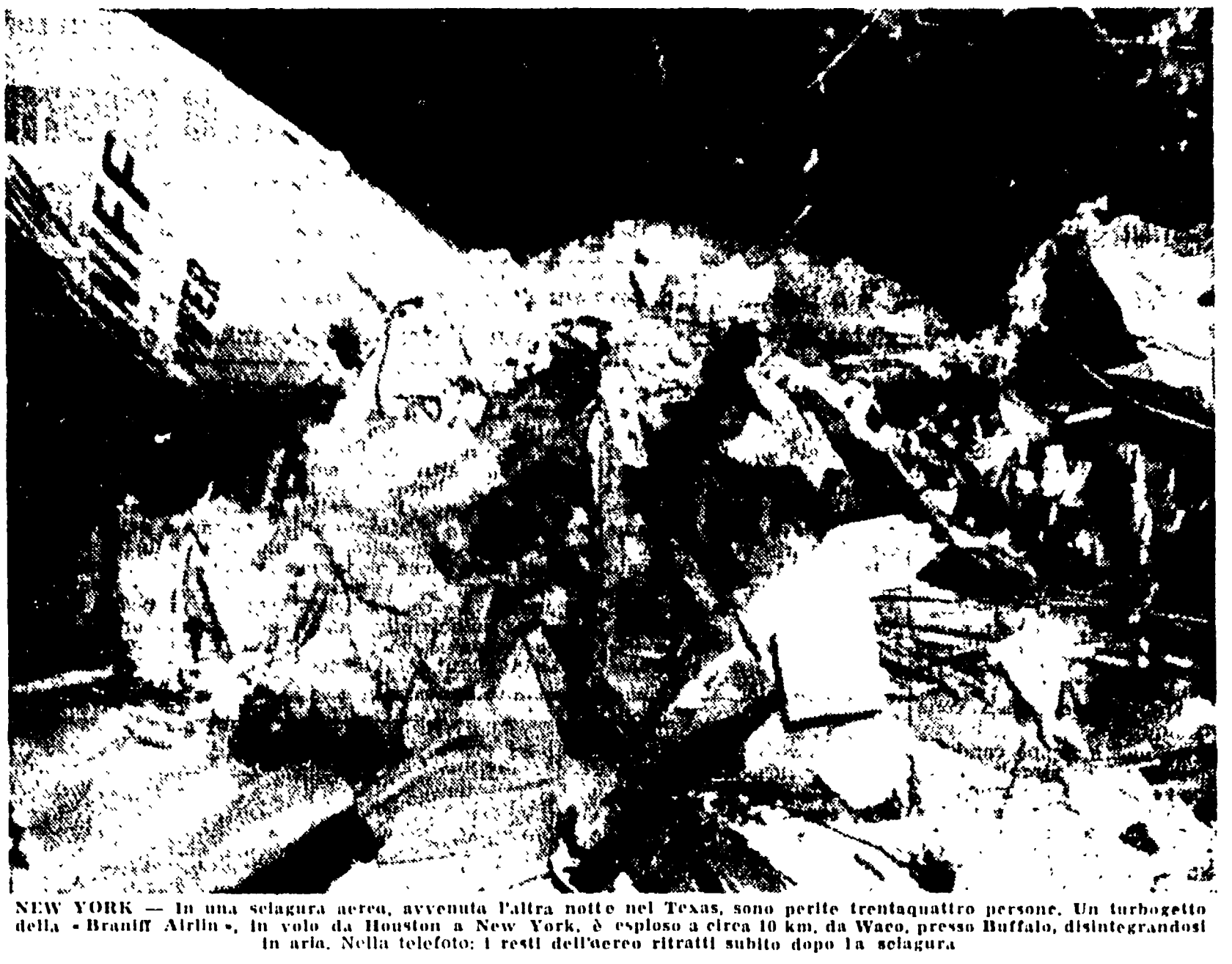
NEW YORK - In una selatura aerea, avvenuta l'altra notte nel Texas, sono perite trentaquattro persone. Un turbogetto della Braniff Airlines, in volo da Houston a New York, è esploso a circa 10 km. da Waco, presso Buffalo, disintegrandosi in aria. Nella foto: i resti dell'aereo ritirati subito dopo la selatura.