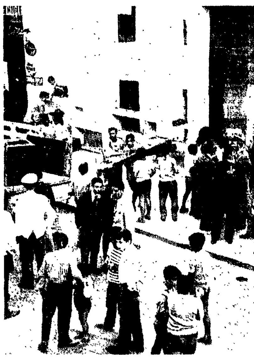
L'edificio di via Serbelloni

dell'ufficio tecnico del comune, o del Genio Civile. Si pone invece, ed in termini urgenti e drammatici, il problema di trovare una nuova abitazione. Problema reso drammatico, nel fatto che una parte di esse è composta da modesti lavoratori che a costo di sacrifici, ed economie avevano acquistato l'appartamento, pagandolo mezzo milione a vano.