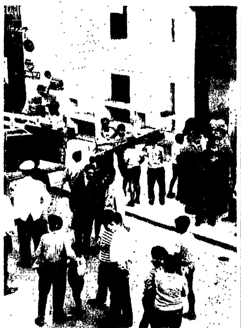
L'edificio di via Serbelloni