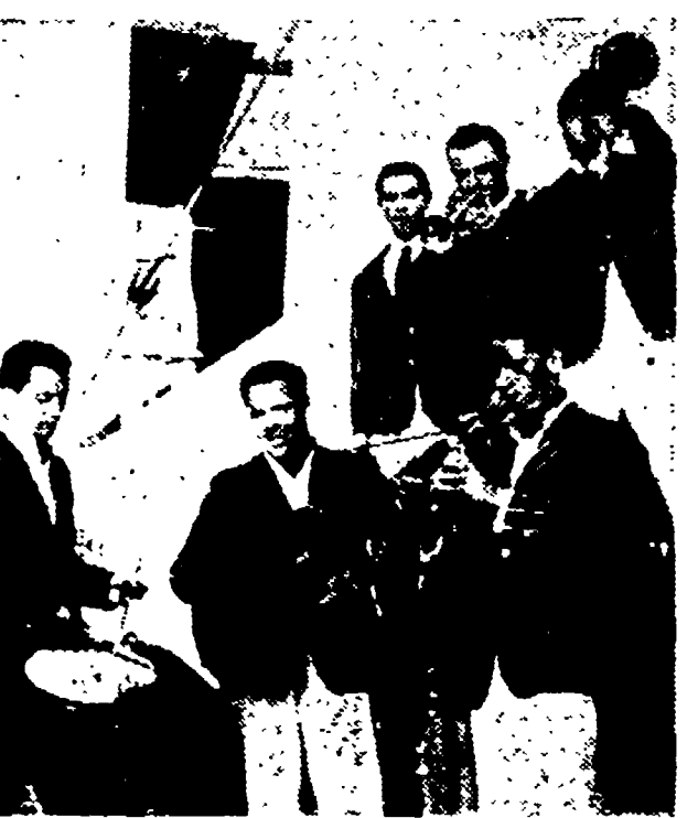
LA II ROMAN NEW ORLEANS — Il notissimo complesso di jazz, che si impone al Festival della gioventù di Mosca e che è conosciuto e apprezzato in tutta Italia, si esibirà alle ore 16 sul palco centrale