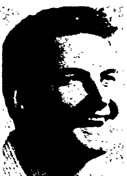
PAOLO BACILIERI — Il noto cantante della rubrica televisiva «Il musicchiere» si esibirà sul palco centrale