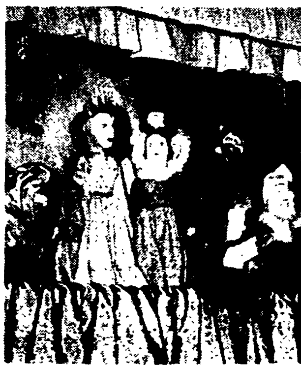
IL TEATRINO DEI SARZI — Nella mattinata alle ore 10, sul palco centrale, si svolgerà uno spettacolo per i bambini con il teatro dei burattini dei Sarzi. Lo spettacolo sarà ripetuto alle 16.

Linea autobus 91: da piazza Venezia a viale di Tor Marancia (via Cristoforo Colombo). Linea autobus 93: da piazza del Cinquecento (Stazione Termini) alla via Cristoforo Colombo. Linea tram 5: da piazza Istria a via Giacomo Rho (Garbatella). Linea tram 11: da via Tiburtina (Portonaccio) a via Giacomo Rho (Garbatella).