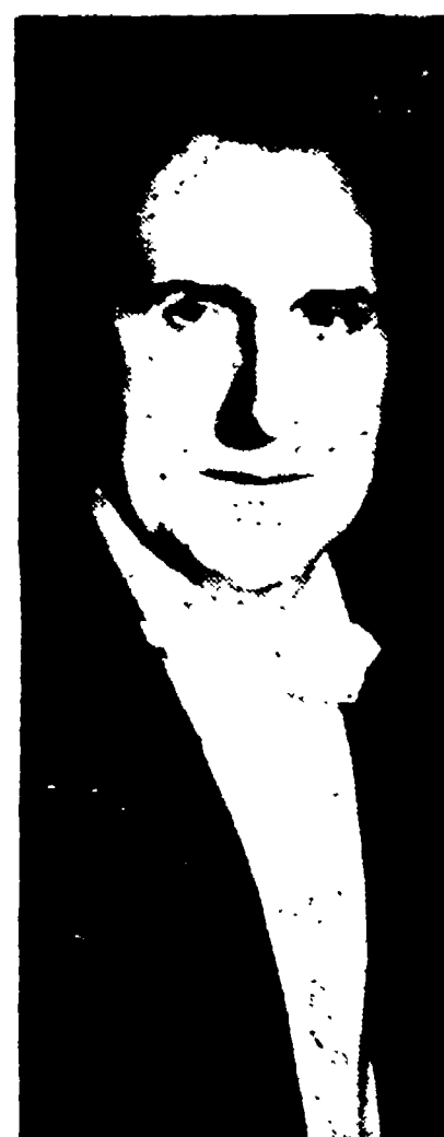
NELLO SEGURINI — Il noto direttore d'orchestra parteciperà al varietà musicale delle ore 18 sul palco centrale

ORE 10 — Spettacolo per bambini, con il Teatro dei burattini dei Sarzi e attrazioni varie. ORE 11 — Incontro di pugilato. ORE 15 — Elezione di «Miss Vie Nuove» e programma di canzoni del «duo Jolli».