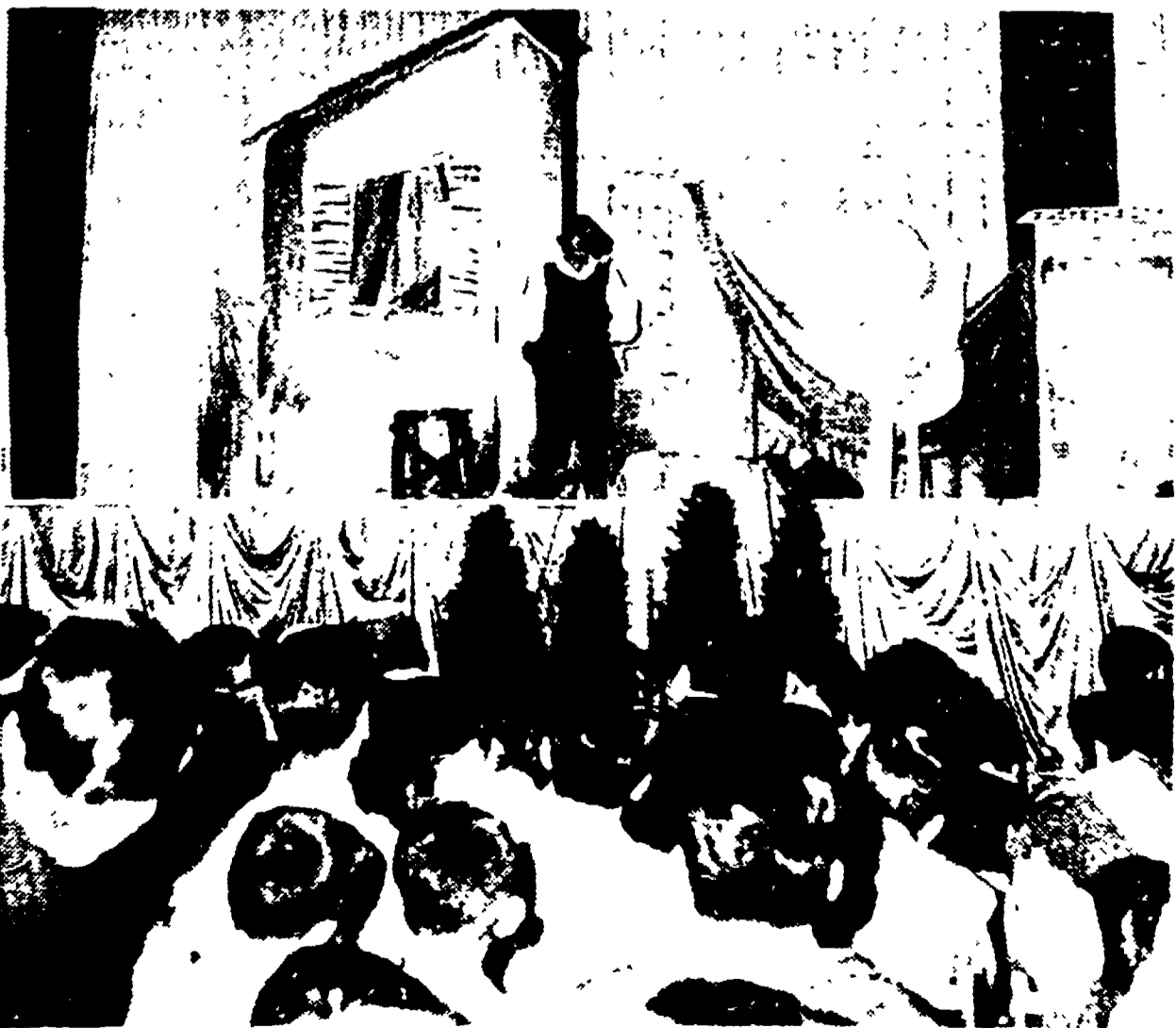
Sul palcoscenico del teatro centrale, si è svolta nella mattinata la rappresentazione della « Mesccheta » del Ruzante, presentata dalla compagnia di prosa « La Tenda ». Il tempo minaccioso pioggia, grossi nuvoloni neri solcavano il cielo. Ma la festa aveva già avuto il suo battesimo di visitatori. Quando gli spettatori sono usciti dal teatro, qua e là, nel cielo ancora incerto, si aprivano i primi, beneaugurali spiragli di azzurro.