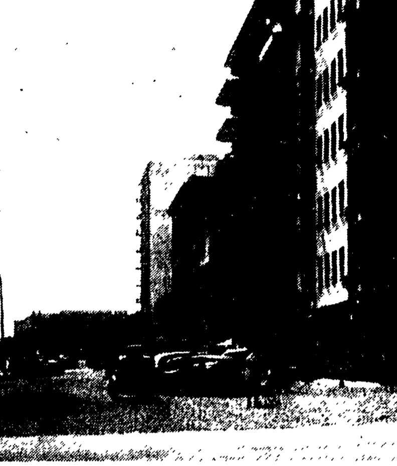
Da molti anni il tratto di strada della Tuscolana che va da via Cella a piazza S. Maria Ausiliatrice è nelle condizioni che la foto rende solo in modo approssimativo. La carreggiata stradale utilizzabile è limitatissima, mentre resta a fondo naturale la maggior parte dell'area davanti agli edifici. L'attuale situazione è il risultato della politica del «lavori pubblici» vantata dal sindaco Ciocchetti.