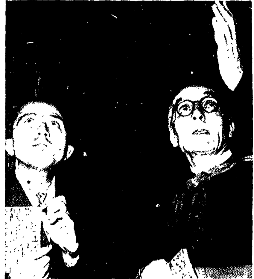
Il ministro Andreotti e mons. Galloro

coll' burocratici, della corruzione e del sottogoverno di parte autonomie locali e dell'Ente regione. La lotta delle opposizioni in Campidoglio, contro il Piano regolatore fatto su misura per gli speculatori, è più in generale contro le conseguenze morali e politiche dell'alleanza clerico-fascista, ha consentito energiche critiche a Ciocchetti e alla sua gestione amministrativa. Alla vigilia del congresso, il Messaggero aveva pubblicato un significativo articolo contro «la povertà di idee della DC romana, in aperto contrasto con gli enormi problemi e con le grandi aspettative di questa nostra città di due milioni di abitanti». Paglietti e Darida hanno ripreso