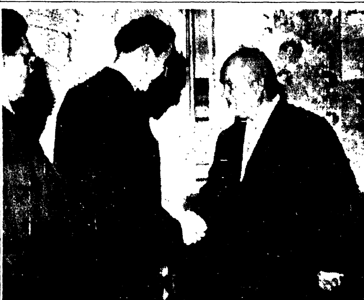
MOSCA - La cordiale stretta di mano tra Del Bo e Krusciov