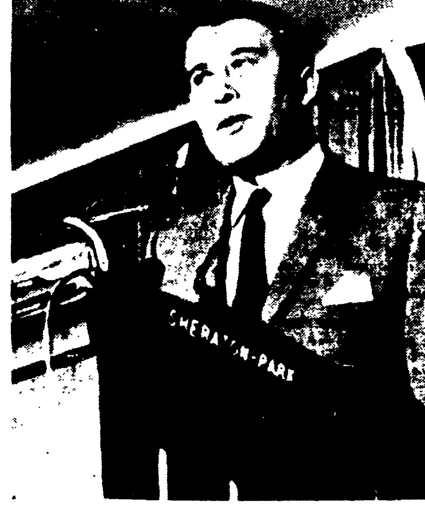
WASHINGTON - Von Braun durante la conferenza-stampa