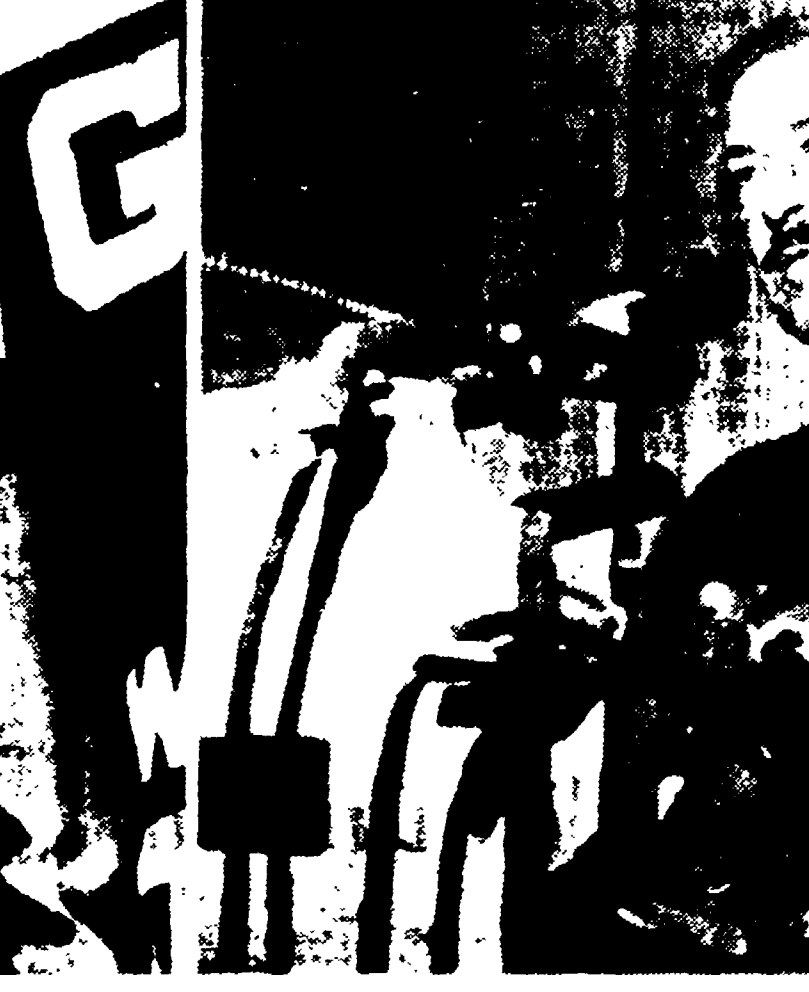
NEW YORK - Il gen. Medaris, annuncia le sue dimissioni

WASHINGTON, 21. - Il fronte spaziale americano appare agitato da una seria crisi. Eisenhower nell'intento di fare il punto della situazione e vedere l'azione da svolgere per migliorare i risultati dell'attività in questo settore, risultati poco soddisfacenti di fronte a quelli sovietici, ha convocato oggi alla Casa Bianca una riunione dei principali esperti della materia. Fra questi, caso inespugnabile, è stato convocato Von Braun, lo scienziato che ieri sera ha parlato alla «Associazione Bancaria» del Kentucky. Prima di pronunciare la conferenza è stato riferito, egli è stato invitato dal vice capo dell'ufficio informazioni dell'esercito di cambiare alcuni passi; del suo discorso scritto. Von Braun così ha fatto «per non creare del fermento» - ha dichiarato - alla vigilia della riunione della Casa Bianca.