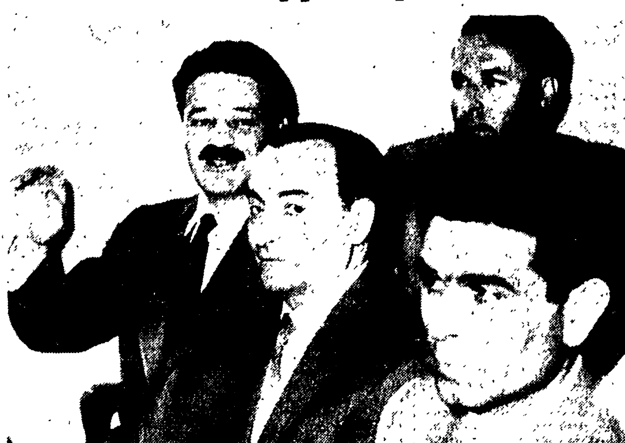
Domani, lunedì, la corte militare di Atene prenderà in esame il ricorso presentato dal collegio di difesa di Glezos contro la condanna a 5 anni che il tribunale marziale pronunciò il 22 luglio scorso, ai danni dell'eroe dell'Aeropolis. Anche in occasione di questo dibattimento, come già avvenne durante il processo di prima istanza, sarà presente la solidarietà dei democratici di tutto il mondo con il dirigente popolare ellenico. Nella foto: Glezos (a sinistra) durante il processo del luglio scorso

L'Agenzia Ceteka informa inoltre che il governo cecoslovacco si riserva il diritto di chiedere risarcimenti di tutti i danni subiti. L'esplosione degli aerei ed il conseguente incendio provocato hanno causato considerevoli danni materiali.